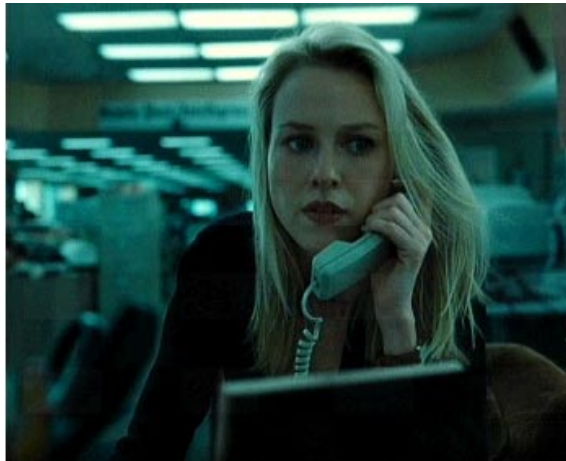
Obrázek číslo 3 – Telefonistka

Klient položí zkoušejícímu postupně 5 otázek.