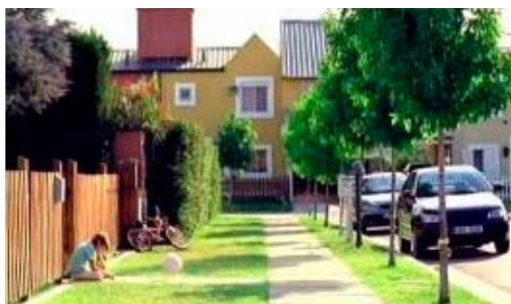
Obrázek číslo 2 – Ulice