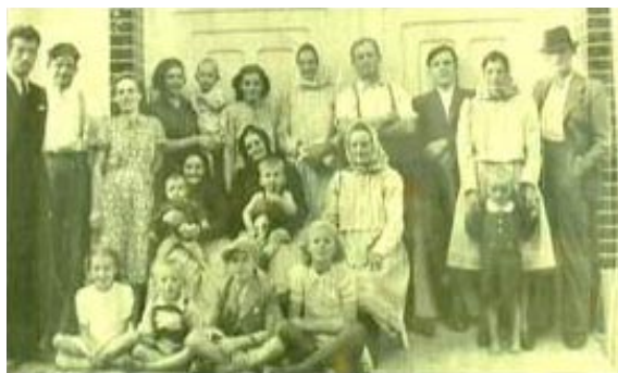
Obrázek číslo 1 - Rodinná fotografie