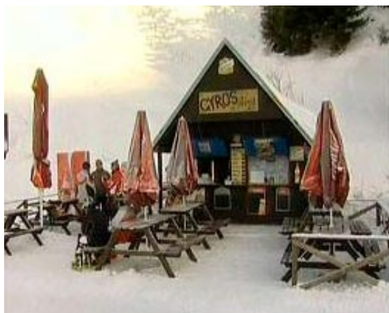
Obrázek 5 – Na horách

Klient položí zkoušejícímu postupně 5 otázek.