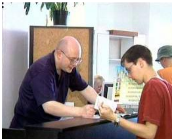
Obrázek 6 – Informační kancelář

Klient min. v 5 větách volně popíše obrázek.