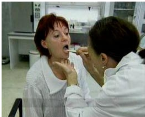
Obrázek číslo 4 – U lékaře

Klient položí zkoušejícímu postupně 5 otázek.